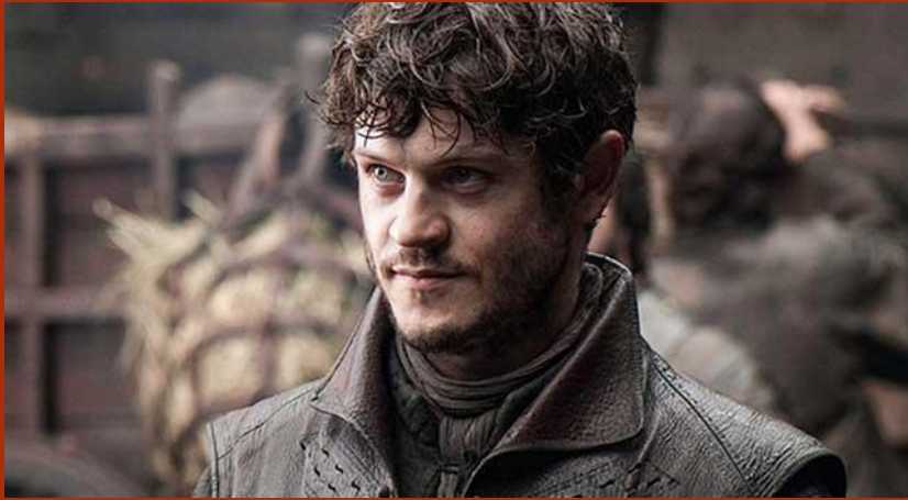
Ramsay Bolton del Trono di Spade