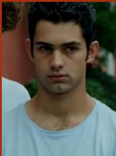
Carmine di Mare Fuori