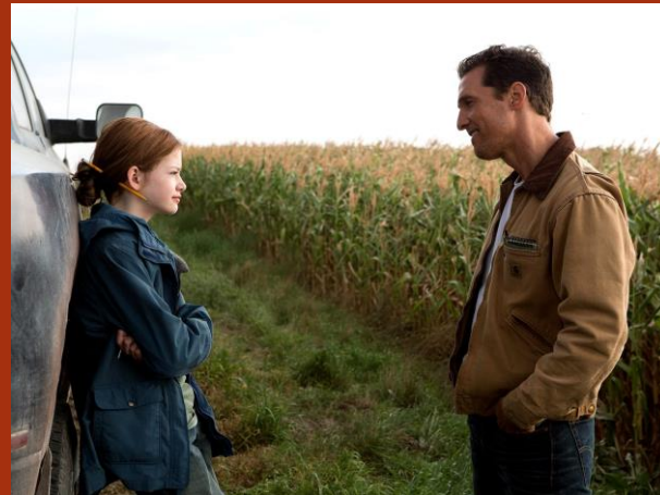
Joseph Cooper di Interstellar