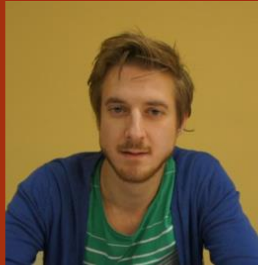
Rory Williams del Doctor Who